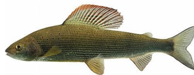
Ombre commun ( Thymallus thymallus )

Depuis le milieu des années 2000, des captures d'ombre commun ont été recensés par les pêcheurs de l'AAPPMA sur le secteur aval du Sichon, en limite amont du secteur chenalisé de l'agglomération Vichyssoise. Des individus de taille variable semblent avoir été capturés. Des données plus anciennes de l'ONEMA (ex. CSP) de 1987 montrent également la présence de cette espèce au niveau de la station de suivi piscicole de l'Ardoisière.